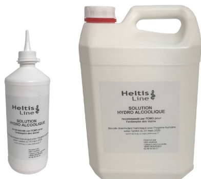
316HGH300 Flacon 1 L