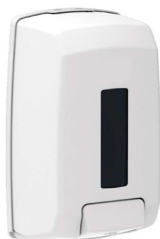
316HGH330 Distributeur 1,1L